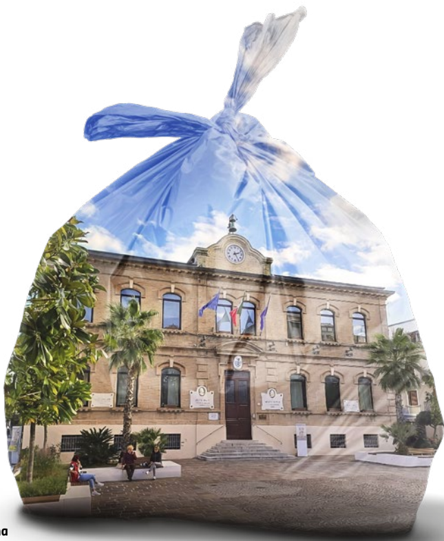
Palazzo Pergoli, Falconara Marittima